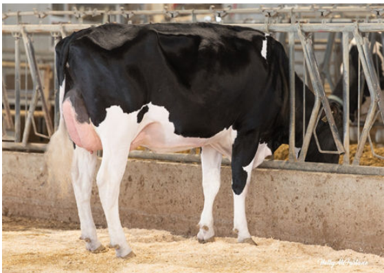
PROGENESIS RANGER LENNON DAM